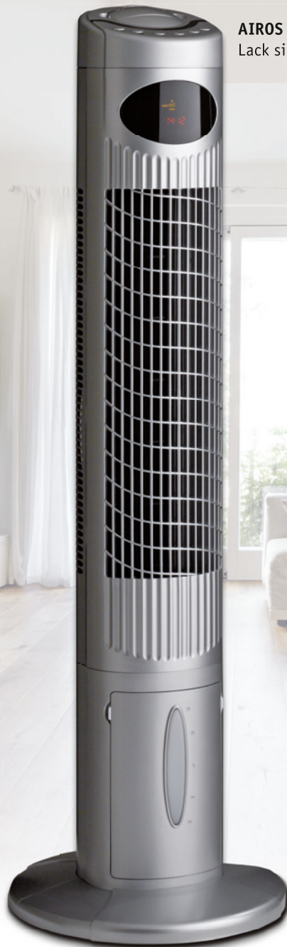
AIROS COOL #67549 Lack silber satin