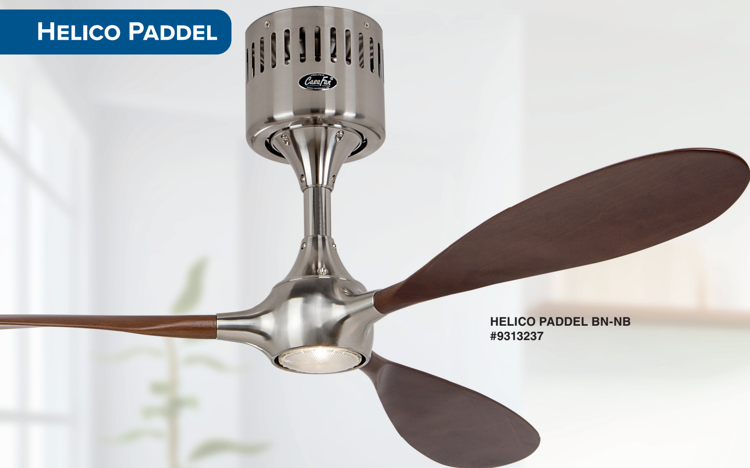
HELICO PADDEL BN-NB #9313237