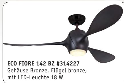
ECO FIORE 142 BZ #314227 Gehäuse Bronze, Flügel bronze, mit LED-Leuchte 18 W

Funk-Fernbedienung (Motor 6 Stufen, Licht an/aus, Vor-/Rückwärtslauf), Wandhalter im Lieferumfang enthalten.