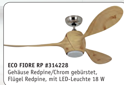
ECO FIORE RP #314228 Gehäuse Redpine/Chrom gebürstet, Flügel Redpine, mit LED-Leuchte 18 W