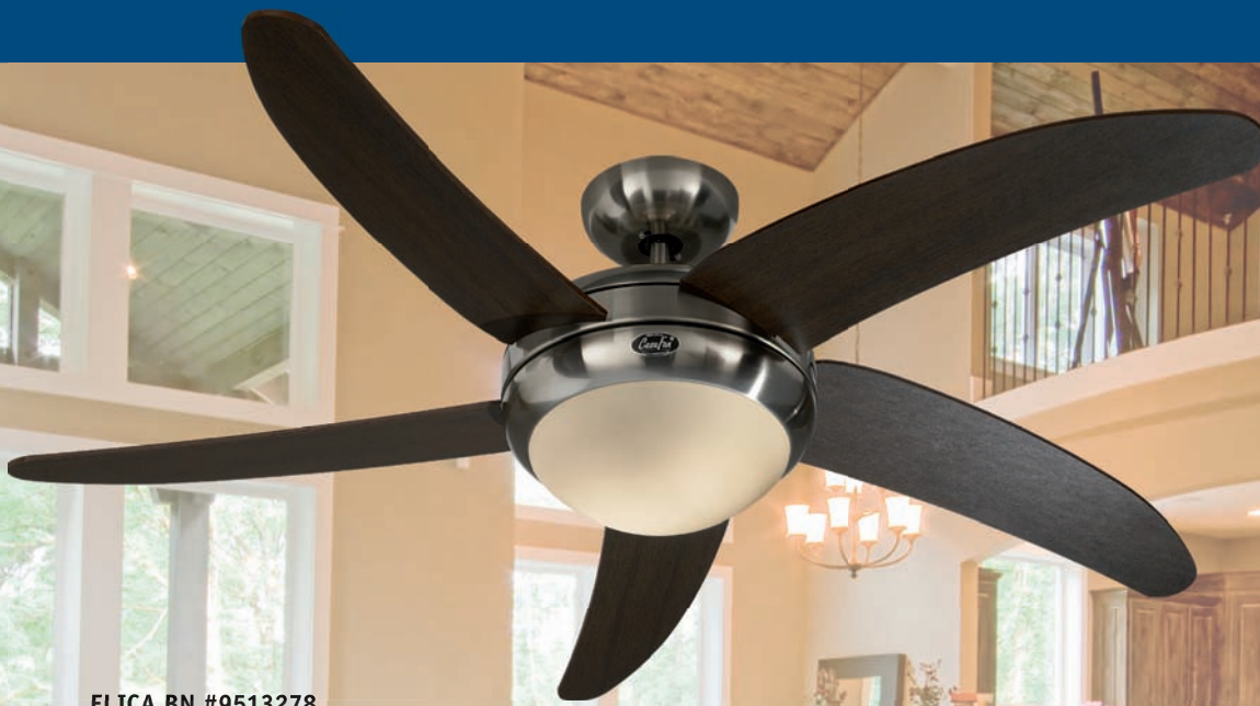
ELICA BN #9513278 Gehäuse Chrom gebürstet, Sichelflügel Wenge