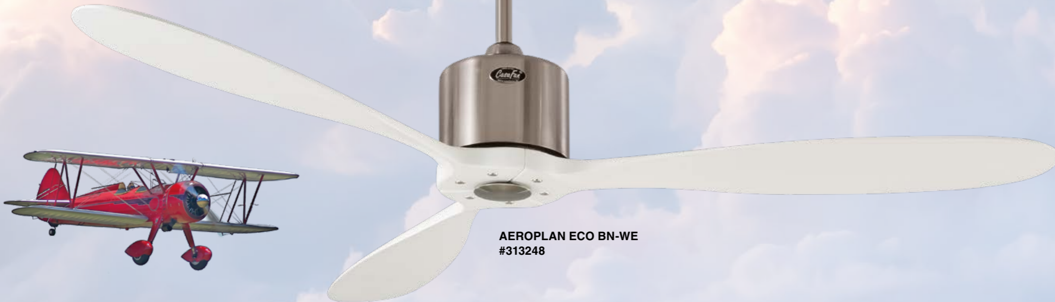
AEROPLAN ECO BN-WE #313248