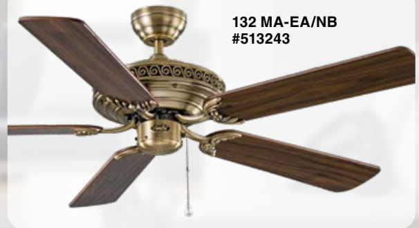
132 MA-EA/NB #513243