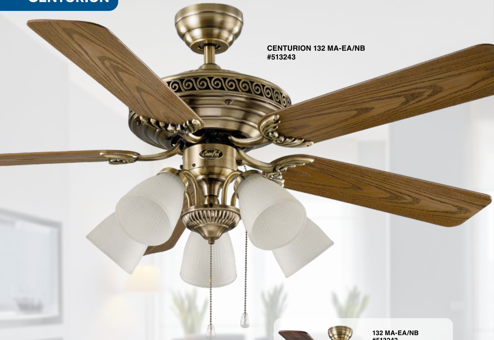
CENTURION 132 MA-EA/NB #513243