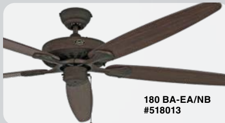
180 BA-EA/NB #518013