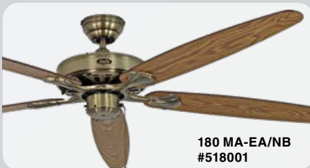
180 MA-EA/NB #518001