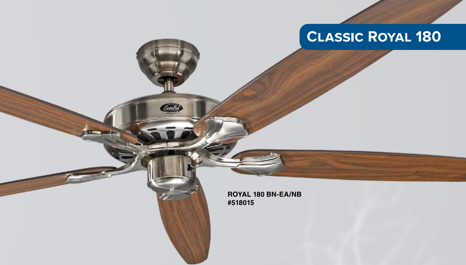
ROYAL 180 BN-EA/NB #518015