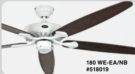
180 WE-EA/NB #518019