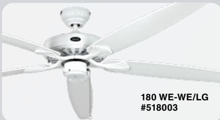
180 WE-WE/LG #518003