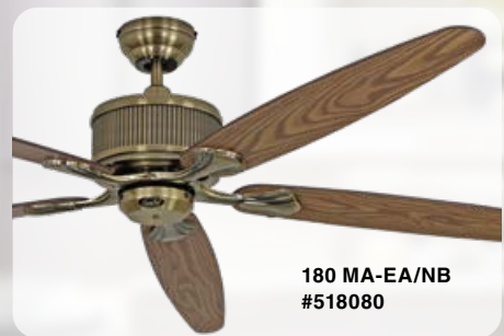
180 MA-EA/NB #518080