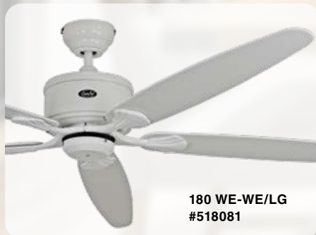
180 WE-WE/LG #518081