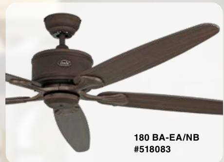
180 BA-EA/NB #518083