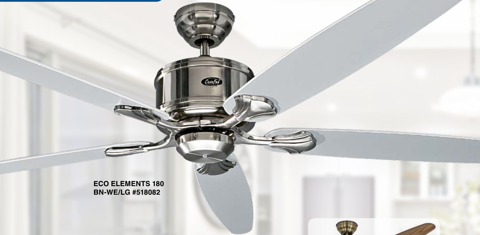
ECO ELEMENTS 180 BN-WE/LG #518082