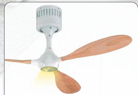
HELICO PADDEL WE-BU #9313238 Gehäuse Lack weiß, 3 gefräste Flügel aus Massivholz, Buche