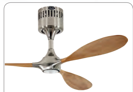
HELICO PADDEL BN-BU #9313236 Gehäuse Chrom gebürstet, 3 gefräste Flügel aus Massivholz, Buche