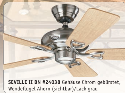
SEVILLE II BN #24038 Gehäuse Chrom gebürstet, Wendeflügel Ahorn (sichtbar)/Lack grau