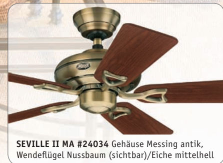
SEVILLE II MA #24034 Gehäuse Messing antik, Wendeflügel Nussbaum (sichtbar)/Eiche mittelhell