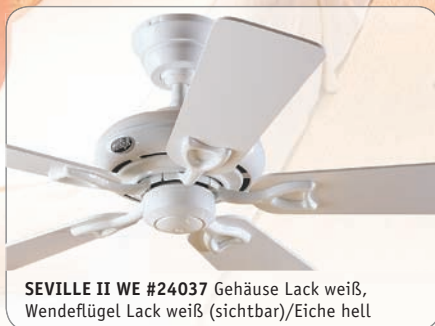
SEVILLE II WE #24037 Gehäuse Lack weiß, Wendeflügel Lack weiß (sichtbar)/Eiche hell